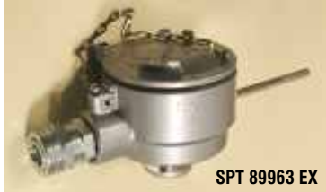
SPT 89963 EX

Опция: Трансмиссер аналогового сигнала 4-20mA