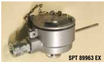
SPT 89963 EX

Опция: Трансмиссер аналогового сигнала 4-20mA